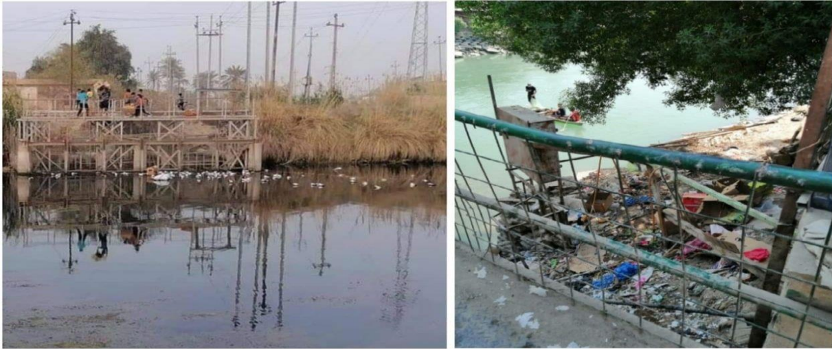
صورة (١) رمي النفايات في جانب شط الشامية

تزايدت ظاهرة القاء النفايات الصلبة في مجرى شط الشامية في مدينة الشامية نتيجة ضعف الوعي البيئي لدى الافراد وقناعتهم بقدرة النهر على تصريف المخلفات ، فضلا عن غياب تطبيق القانون ونقص خدمات البلدية ، فكثير ما نشاهد اكياس النايلون وقطع البلاستيك وقناني المياه الفارغة وبقايا الطعام و الفواكه والخضروات وجثث الحيوانات النافقة وغيرها تطفو على سطح مياه النهر ، اصف الى ذلك ان بعض هذه النفايات مثل العلب المعدنية ونفايات بلاستيكية لها القدرة على مقاومة الظروف الطبيعية وتبقى في المياه ثابتة لا تتغير لسنوات عديدة وعند تحللها يؤدي الى استنزاف كمية كبيرة من الاوكسجين الذائب في الماء وهذا يؤدي الى تناقص الاحياء المائية (١٤) صورة ( ١ ) .